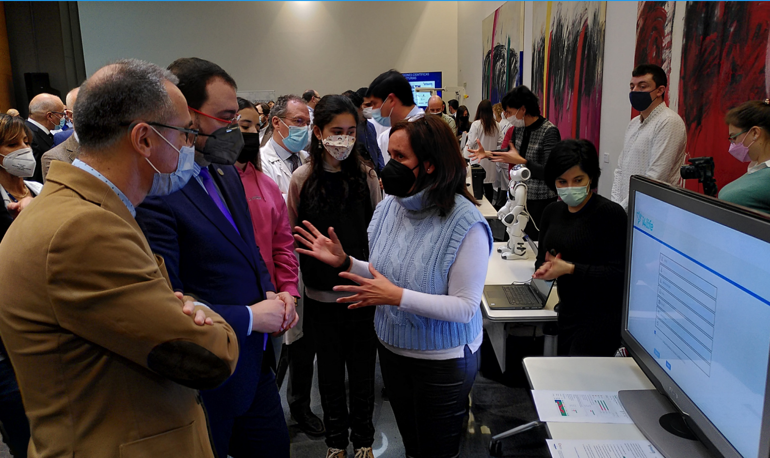
Presentación de la misión eHealth por parte del consorcio de entidades en las que MediaLab participó como colaborador