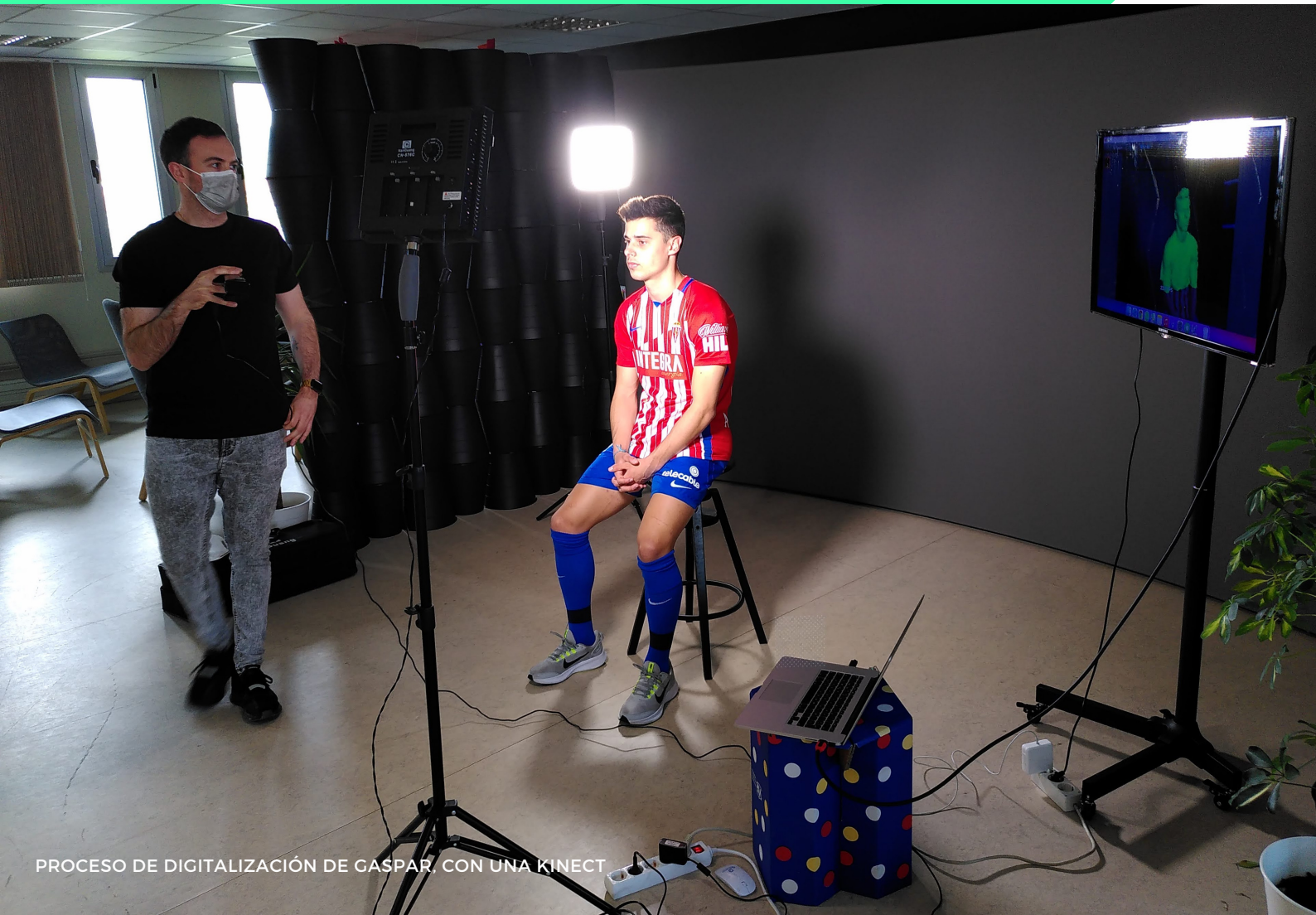
PROCESO DE DIGITALIZACIÓN DE GASPAR, CON UNA KINECT