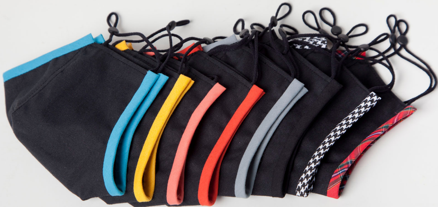
MÁZCARU MASCARILLA REUTILIZABLE DE YSI., SPIN OFF DEL MEDIALAB.